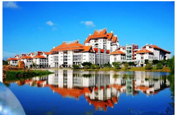
嘉庚学院主校楼群